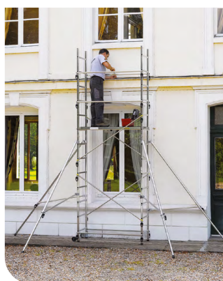
Speed'Up XL hauteur du plancher 3 m