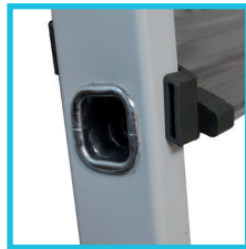
MARCHES EN ALUMINIUM solidement fixées aux montants par sertissage. Largeur 80 mm.