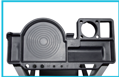
TABLETTE PORTE-OUTILS avec de nombreux espaces de rangements.